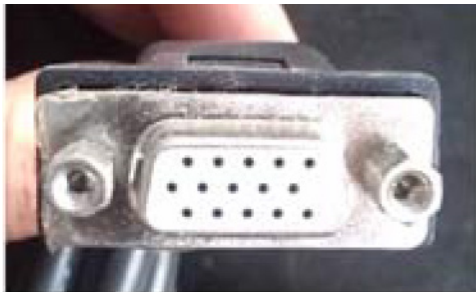
COMPR. PADRAO DO CABO: 2m (3m, 5m e 8m opcional)