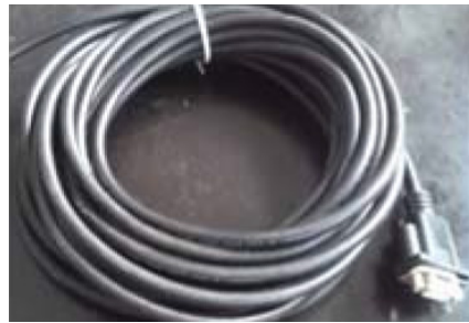
COMPR. CABO ENCODER: 350mm